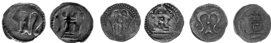
Bite w mennicy koźuchowskiej halerze z pierwszej połowy XV w.