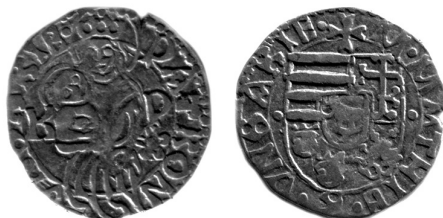
Grosz Macieja Korwina.

woju gospodarczego, któremu towarzyszyło także uzyskiwanie coraz większych swobód samorządowych 73 .