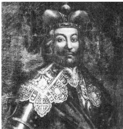
Książę zagański Jan II (1435-1504). Portret z dawnej kolekcji zamku w Głogowie.

było przekazanie praw do księstwa. W ten sposób Władysław próbował umocnić swoje wpływy na Śląsku, jednak jak się szybko okazało nie zamierzał toczyć wojny. Zawarte pomiędzy Brandenburgią a królem Czech umowy ogłoszone zostały publicznie w czerwcu i sierpniu. Na ich mocy król Władysław potwierdził Barbarze prawa do księstwa, a margrabia Albrecht Achilles zobowiązał się do przekazania ziem swojej córki królowi i zagwarantował złożenie przez mieszkańców księstwa hołdu. Ślub „ per procurationem ” odbył się 19 sierpnia we Frankfurcie nad Odrą. Właściwy ślub i koronacja Barbary miały się odbyć 16 lutego 1477 r., jednak na skutek wybuchu wojny, której przebieg okazał się niekorzystny dla Brandenburgii, król czeski zaczął się uchylać od przyjętych zobowiązań względem Barbary 23 . Nie przeszkadzało to jednak w używaniu przez Barbarę tytułu królowej Czech, a przez Władysława – pana księstwa głogowskiego. Już 12 września Władysław wystawił w Pradze dokument informujący, że po ślubie z Barbarą przeszły na niego prawa do ziem pozostawionych przez księcia Henryka, zgodnie z przyrzeczeniem szlachty i miast złożonym wobec jego pełnomocników i radców oraz, że na prośbę tych ziem potwierdza w imieniu swojej małżonki prawa i przywileje stanów. Zobowiązał się także do nieobsadzania stanowisk w księstwie cudzoziemcami 24 .